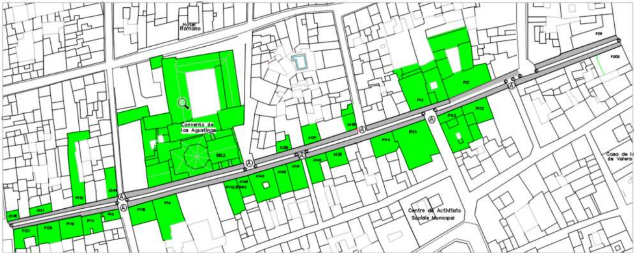
Esquema general gráfico Calle Loreto